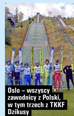
Oslo – wszyscy zawodnicy z Polski w tym trzech z TKKF Dzikusy